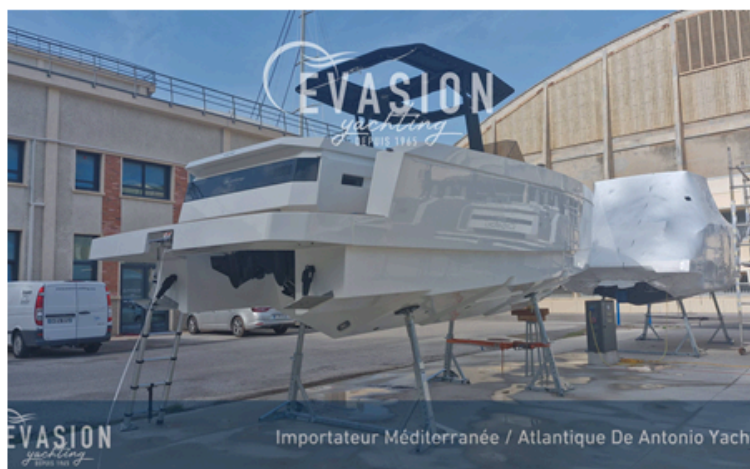
Importateur Méditerranée / Atlantique De Antonio Yachts